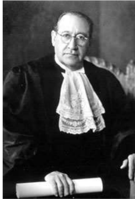
Lic. Isidro Fabela, Enviado Extraordinario y Ministro Plenipotenciario de México ante la Sociedad de las Naciones