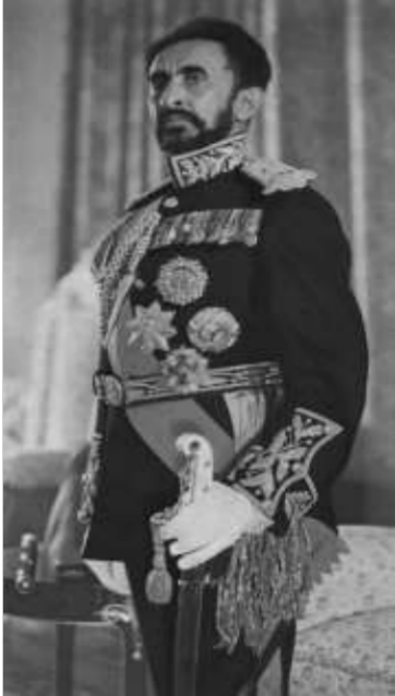
Emperador de Etiopía Haile Selassie I (1930-1936) y (1941-1974)